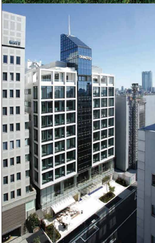
青山OHMOTOビル(東京都港区)

本四高速 本州四国連絡高速道路株式会社 Honshu-Shikoku Bridge Expressway Company Limited http://www.jb-honshi.co.jp/ 詳しくは... 日本四国高速 検索