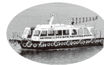
日比野克彦デザイン 海底探査船 「一昨日丸(おとといまる)」