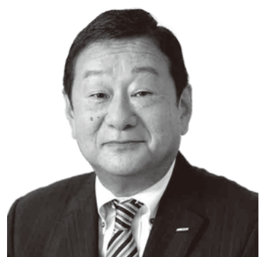
岡山放送 代表取締役社長