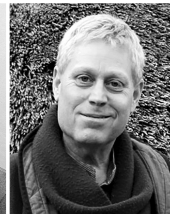
東洋文化研究家 アレックス・カー